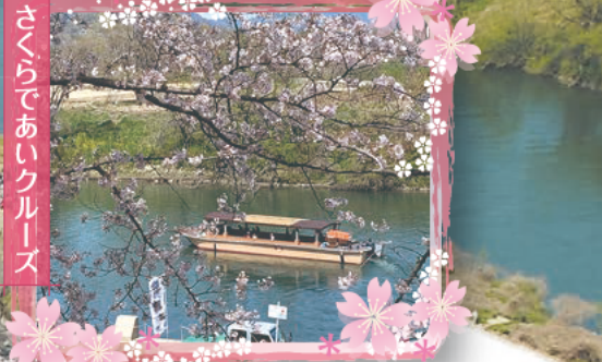
さくらであいクルーズ